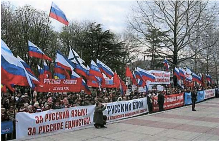
Демонстрация в Симферополе, 20 апреля 2007

20 апреля в Симферополе прошла демонстрация, посвященная 224-й годовщине провозглашения Манифеста Императрицы Екатерины II о принятии острова Тамань, полуострова Крым, и всей Кубан-