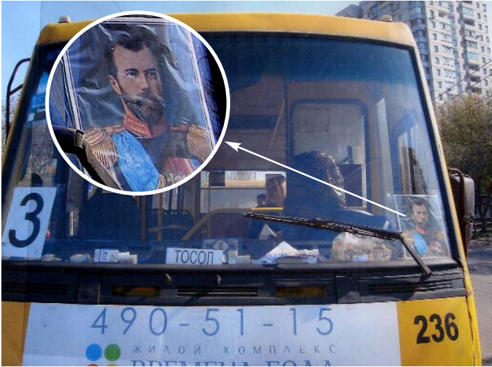
Вот какой автобус в Киеве -- с Св. Царем-Мучеником на лобовом стекле.

Из потомственных дворян, сын жандармского ротмистра. В 1903 году окончил Николаевское кавалерийское училище, в 1913 году - Николаевскую императорскую академию Генерального штаба. Участник Первой мировой войны, подполковник, с 1916 года начальник штаба 37-й пе-