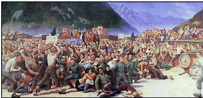
Никто не забыт! Никогда не забудем!

ДУХОВЕНСТВО И ВЕРУЮЩИЕ ОТМЕТИЛИ ПАМЯТЬ ЖЕРТВ ЛИЕНЦА