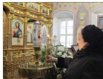
Храм Казанской иконы Божией Матери. Село Константиново, Рязанская обл.