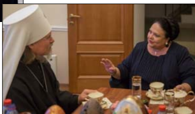
С Высоко-преосвященнейшим Митрополитом Рязанским и Михайловским Марком. Рязань