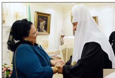
Со Светейшим Патриархом Московским и Всея Руси Кириллом. Москва

Следует краткий фоторепортаж Высочайшего Визита. Более детальное описание всех событий и встреч можно найти на официальном сайте Российского Императорского Дома -- www.imperialhouse.ru .