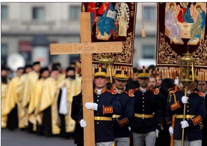
Глава Российского Императорского Дома принял участие в похоронах Короля Румынии Михаила I

16 декабря 2017 года в Патриаршем соборе Бухареста во имя Святых Равноапостольных Царей Константина и Елены Блаженнейшим Даниилом Патриархом Румынским с сонмом духовенства было совершено отпевание Короля Румынии Михаила I, скончавшегося в Швейцарии 5 декабря.