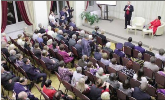
Встреча с общественностью и с руководством города Рязани