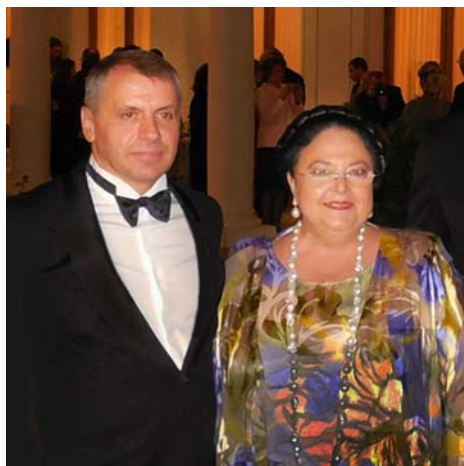
Е.И.В. Великая Княгиня Мария Владимировна и Председатель Верховного Совета Владимир Андреевич Константинов

шистских шагов, которые ведут к расколу украинского народа. Крайние националисты, контролирующие власть в Киеве, начали свою деятельность с откровенно дискриминационных унижительных мер в отношении русскоязычных граждан Украины, с грубого насилия против любых инакомыслящих. Прозвучали явные угрозы в отношении