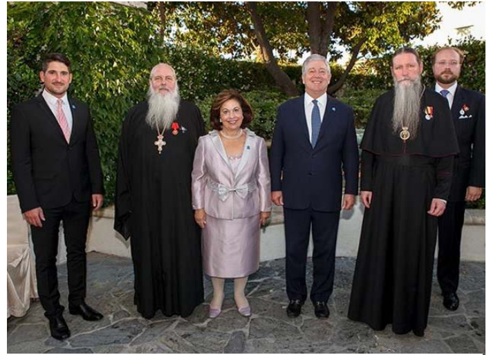
Фотография визита Е.К.В. Принца Александра Сербского в Лос-Анджелес в июне 2013 г.

Справа от Принца Александра стоит Архиепископ Кирилл Сан-Францисский и Западно-американский (Сор.-Рук. РИС-О); слева от Принцессы Екатерины прот. Александр Лебедев.