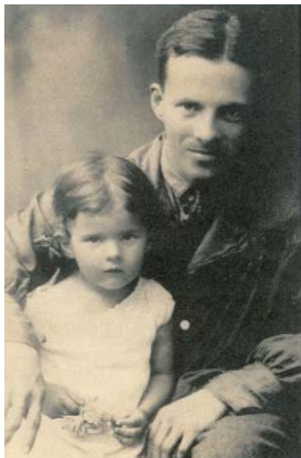
Наташа со своим Папой в 1929г

минала два года проведенные с папой в Крыму между арестами.