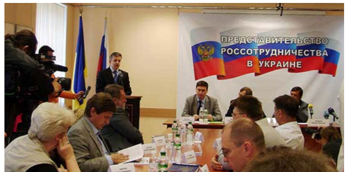
Открыл конференцию Посол Российской Федерации в Украине М.Ю.Зубов.

20 июня 2011 года в Киеве состоялась научно-практическая конференция «Столыпинские реформы и современность», органи-