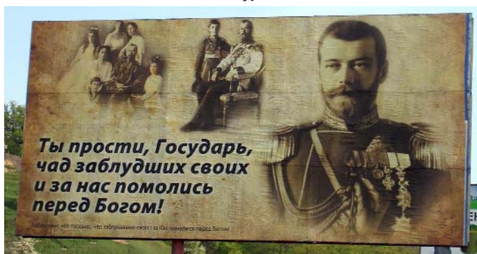
Билборд на трассе Харьков-Киев

СВЯТОЙ ПРЕПОДОБНЫЙ ОТЧЕ НАШ СЕРГИЕ, МОЛИ БОГА О НАС