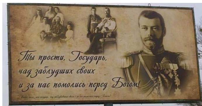
Билборд на Обуховской трассе при въезде в Киев

Однако в подобного рода радостном за братьев по нации «пессимизме» ... пришлось пребывать весьма недолго, ибо уже менее, чем через два месяца было получено сообщение о том, что подобного же типа плакат был выставлен Русскими патриотами недалеко от Полтавы и целого ряда других мест нашего славного историческим прошлым края. И вот теперь, в начале мая 2011 года, целая галерея этих прекрасных изображений появилась, наконец-то, и в районе Матери городов Русских ... Города, отмечая Православное благолепие которого, иностранцы XII в. называли его «Новым Иерусалимом», а один из отечественных летописцев XVI ст. писал, что наступит время, и «засияет златоглавая Москва, аки Второй Киев».