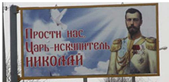
Билборд на трассе Киев - Одесса в районе автобусной остановки «село Круглик»