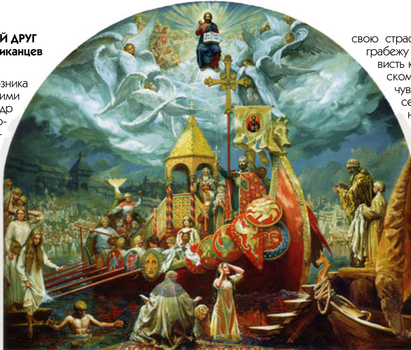
“Крещение Руси” (Москва, июль 2004) - художник Михаил Шаньков. Оригинал находится в церковном доме при Храме-Памятнике Св. Владимира в г. Джаксон, Нью Джерси.

Триллионы долларов, вывезенных за рубеж тем или иным, как правило, мошенническим образом, стали контрибуцией за поражение коммунистического СССР (не России) в холодной войне. Экономическая разруха, уничтожение социальной системы, невиданный произвол бюрократии, обложившей русский народ коррупционной данью в размере 1 триллиона долларов за один президентский срок, невиданное вымирание государствообразующей нации - всё это стало платой за бездумное и корыстное чуждебесие, за девяносто лет привитое поврежденной маловерием русской душе лицемерными поборниками “свободы и демократии”. За красивыми словами о том, что “каждый человек имеет право...”, скрывали они