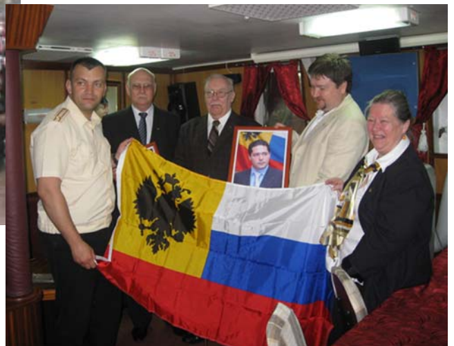
Справа -- 2012 - Санкт-Петербург -- передача знамени и портретов командному составу находившемуся под Высочайшим покровительством корвета "Ярослава Мудрого".