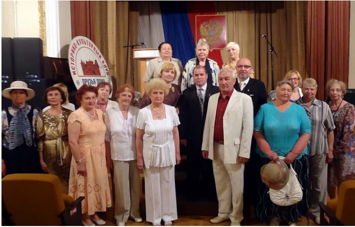
Слева - 2015 -- Воронежский отдел, Рамонь, открытие чтений посвященных 170-летию со дня рождения принцессы Евгении Максимилиановны Ольденбургской.