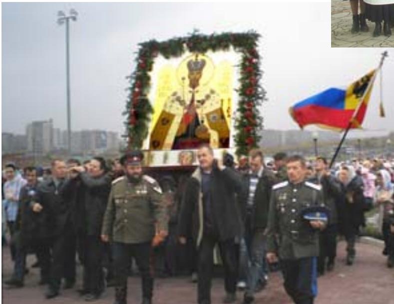
Сверху -- 2006 -- Магнитогорск. Торжественный крестный ход с мироточивым образом Царя-Мученика Николая II.