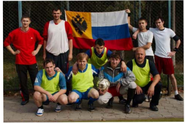
Снизу -- 2011 -- Тульский отдел -- неутомимые футболисты.